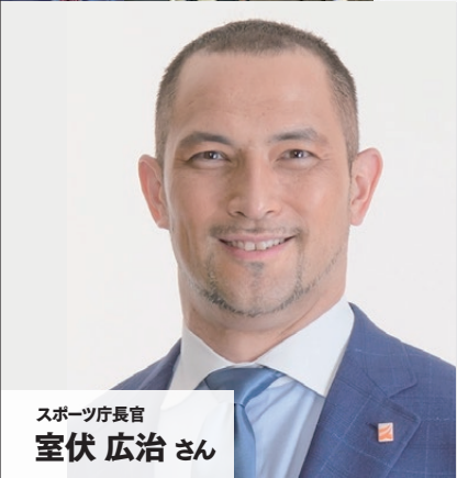
スポーツ庁長官 室伏 広治 さん